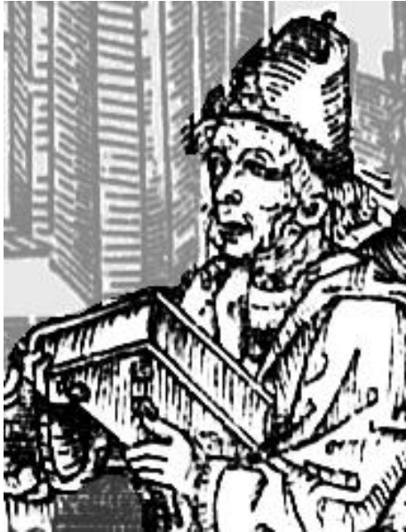
Juan Mena a partir de un grabado de la edición de Zaragoza.

Juan de Mena (1411-1456) fue un buen conocedor de las lenguas clásicas, tal y como exigía su cargo de secretario de cartas latinas en la corte de Juan II. Es autor de algunos poemas de circunstancias , dedicados a ensalzar al rey o a don Álvaro de Luna, de quien era firme partidario; pero ha pasado a la historia gracias a su Laberinto de Fortuna . En dicho poema alegórico, el poeta visita el cristalino palacio de la diosa Fortuna, en el que existen tres ruedas, dos de ellas inmóviles (la del pasado y la del futuro) y una más en movimiento (la del presente). La Fortuna representa el caos, y a ella se asocian elementos negativos como el pecado, la magia, la guerra civil y los nobles desafectos a Juan II. Por el contrario, el ámbito de la Providencia se identifica con la justicia y el orden, y se relaciona con el reinado de Juan II, con Álvaro de Luna y con la propia poesía de Mena.