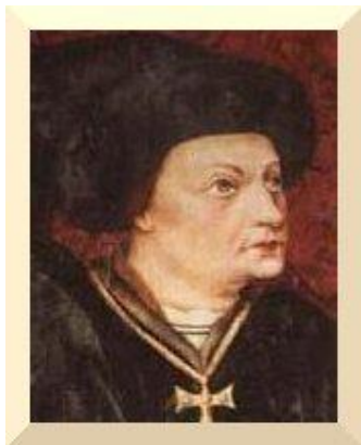
EL marqués de Santillana

Íñigo López de Mendoza (1398 -1458) combina su participación en las guerras civiles de su época con un gran interés por la cultura clásica. No conoce el latín ni el griego, pero encarga traducciones de Platón, Virgilio, Plutarco... así como de Dante. La producción del Marqués abarca varias vertientes: