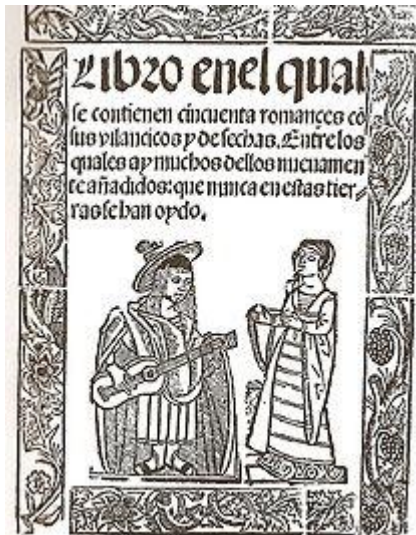
Portada del Libro de los cincuenta romances .

En un principio, la palabra "romance" servía para definir a la lengua vulgar frente al latín. Es hacia el siglo XV cuando se emplea para referirse a una composición poética extensa, octosilábica, cuyos versos pares riman en asonancia . Debemos distinguir: